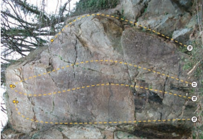
SECTEUR DIRECTE AMERICAINE